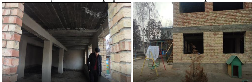
Рисунок 3. Фотографии объекта в с. Ата-Мерек