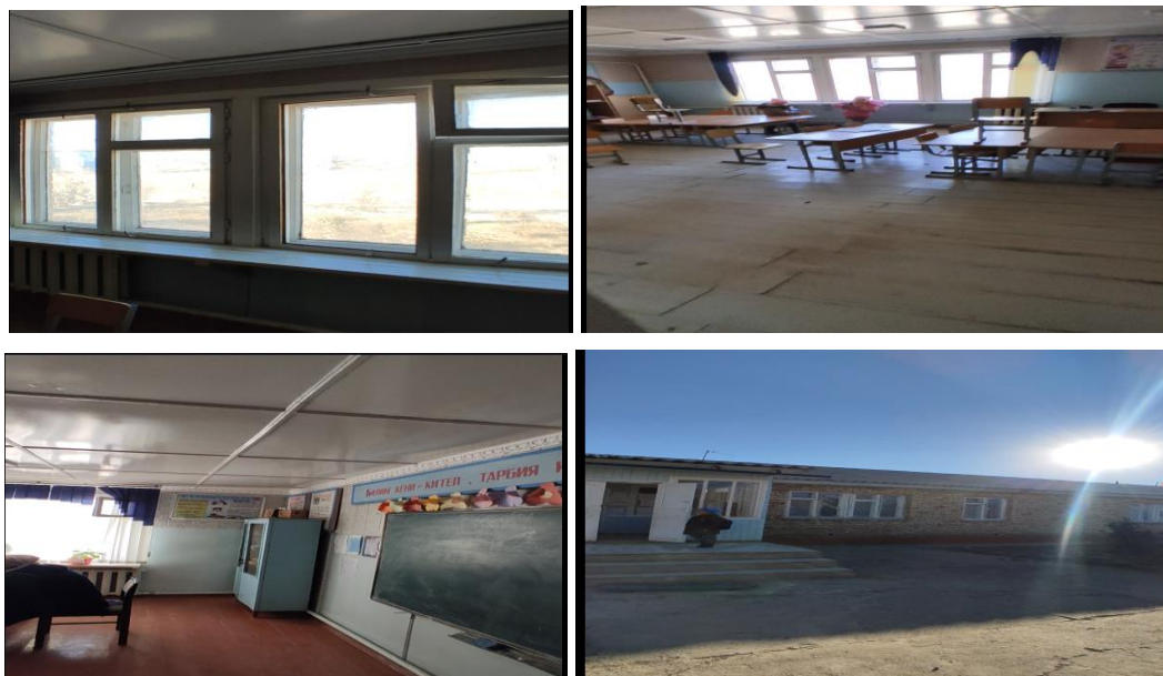
Рисунок 3. Фотографии объекта в с. Тегене