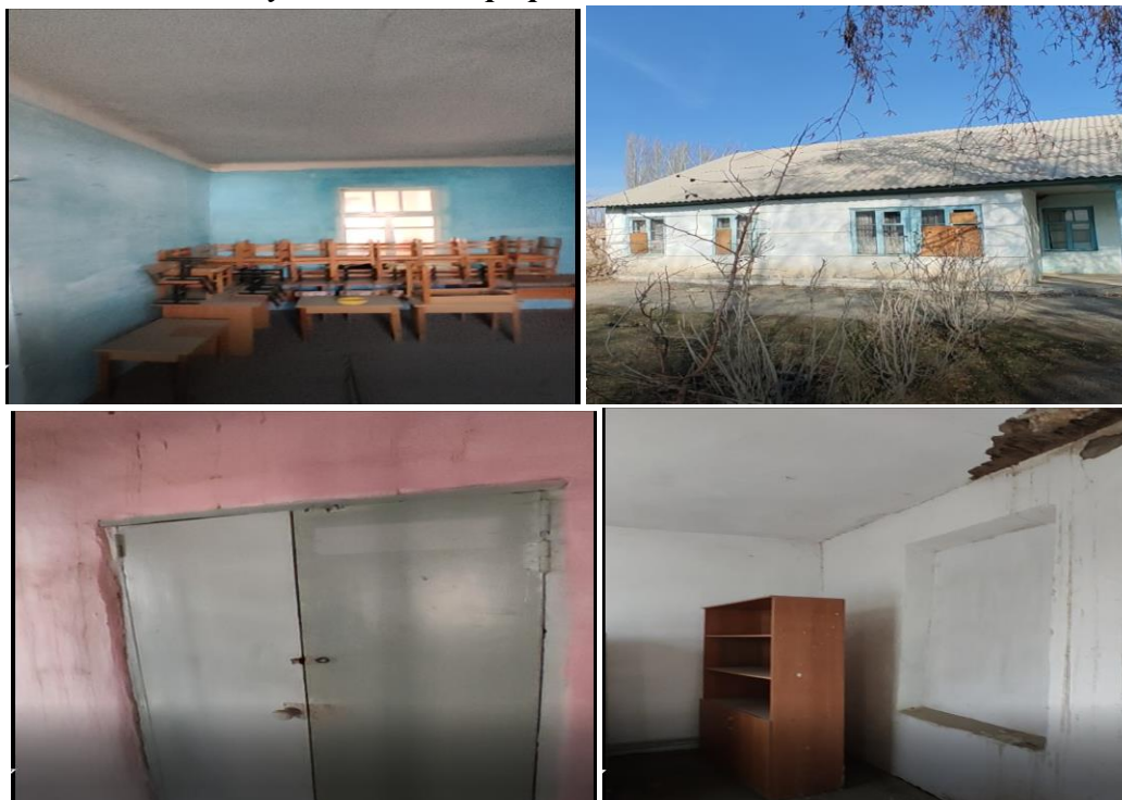
Рисунок 3. Фотографии объекта в с. Тоготой