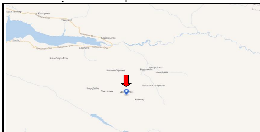
Рисунок 2. Место расположение объекта