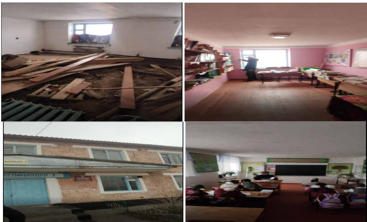
Рисунок 3. Фотографии объекта в с. Жетиген