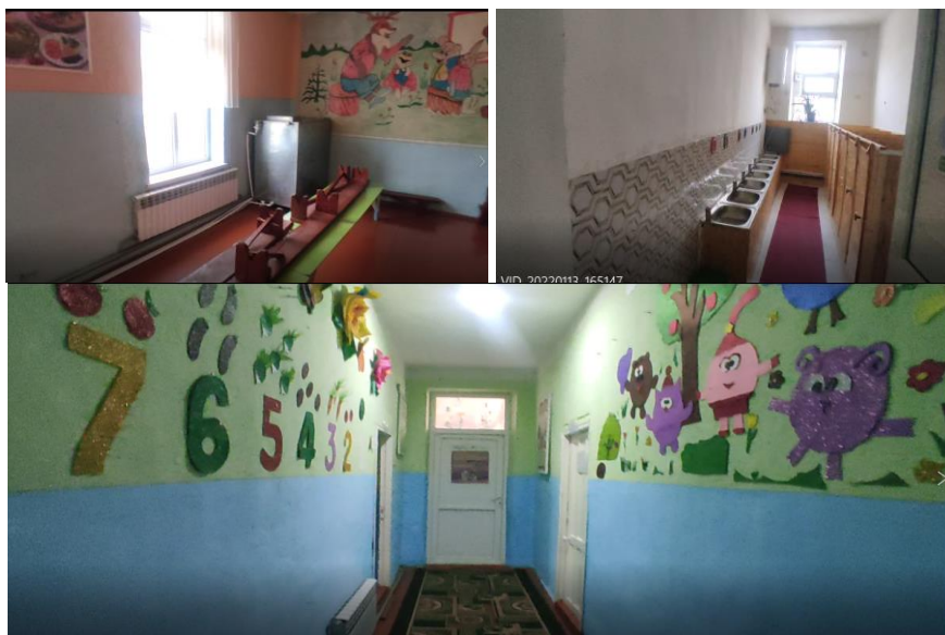
Рисунок 3. Фотографии объекта в с. Куу Майдан