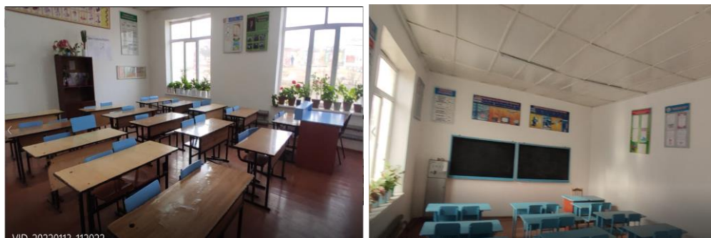
Рисунок 3. Фотографии объекта в с. Кок-Бел