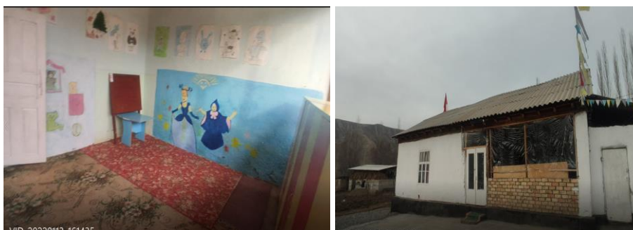
Рисунок 3. Фотографии объекта в с. Чегеден