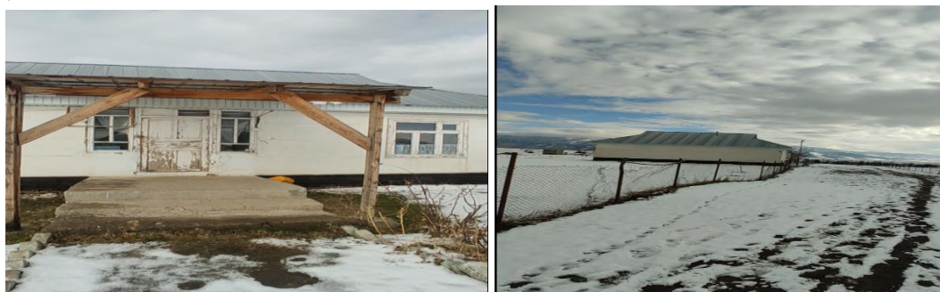
Рисунок 3. Фотографии объекта в с. Сары-Булак