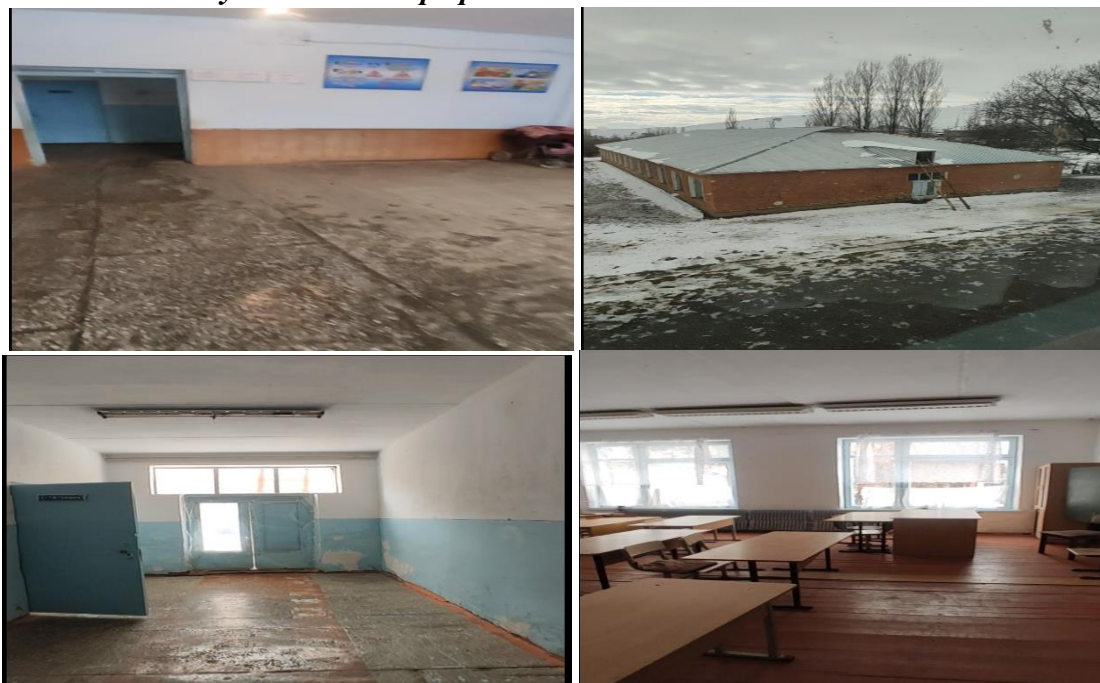
Рисунок 3. Фотографии объекта в с. Ак-Тоок