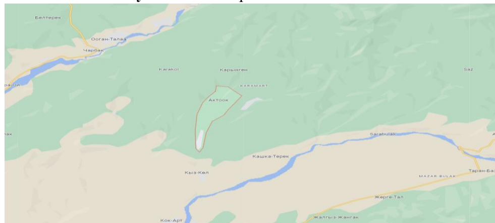
Рисунок 2. Место расположение объекта

В селе Ак-Тоок расположен детский сад который в данное время функционирует и находится в удовлетворительном состоянии. Для создания ОДС кратковременного пребывания в вышеуказанном здании выделяются отдельно комнаты, в которых требуется провести ремонтно-восстановительные работы.