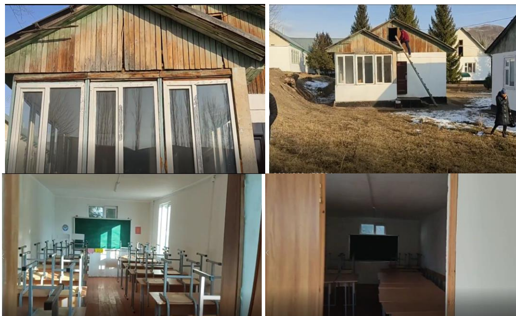
Рисунок 3. Фотографии объекта в с. Сары-Согот