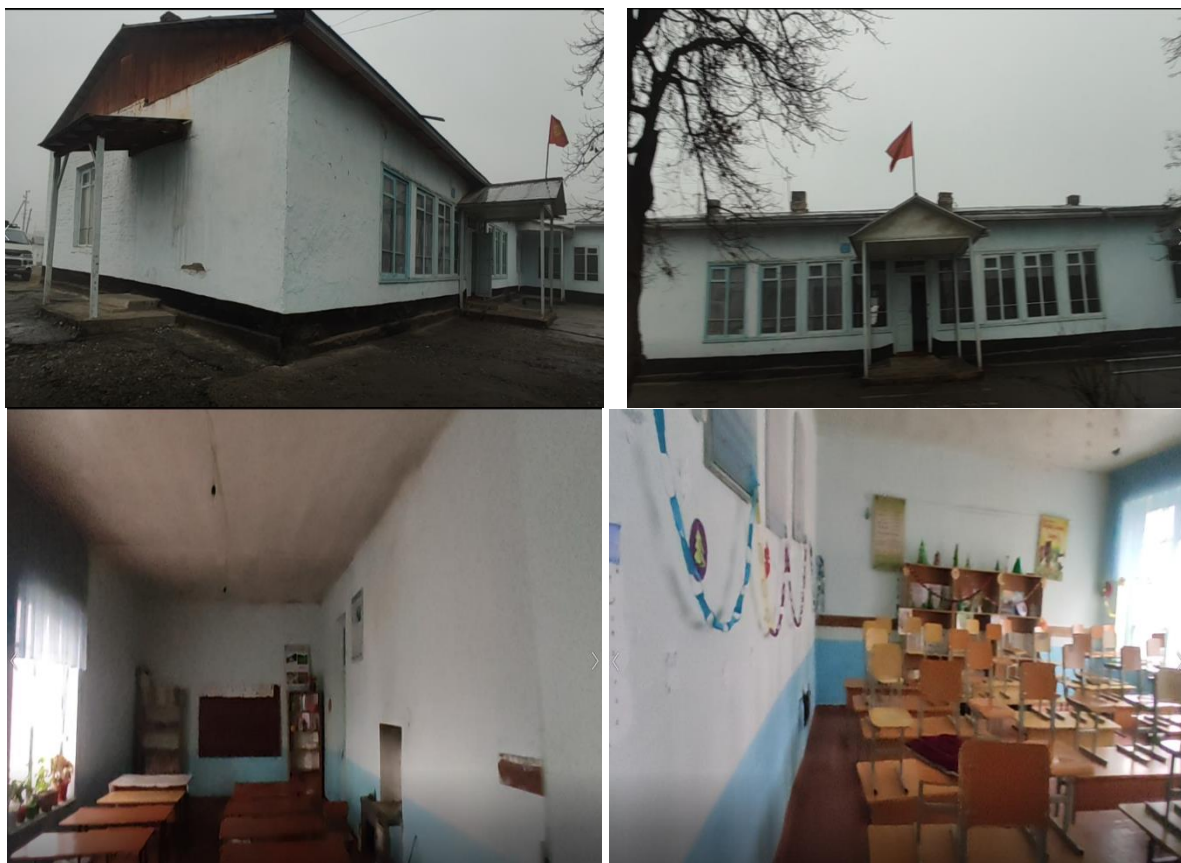
Рисунок 3. Фотографии объекта в с. Курбан-Кара