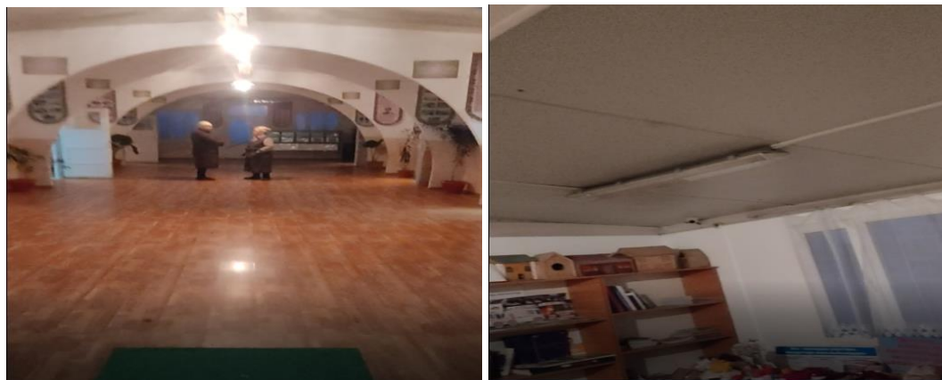
Рисунок 3. Фотографии объекта в с. Присавай