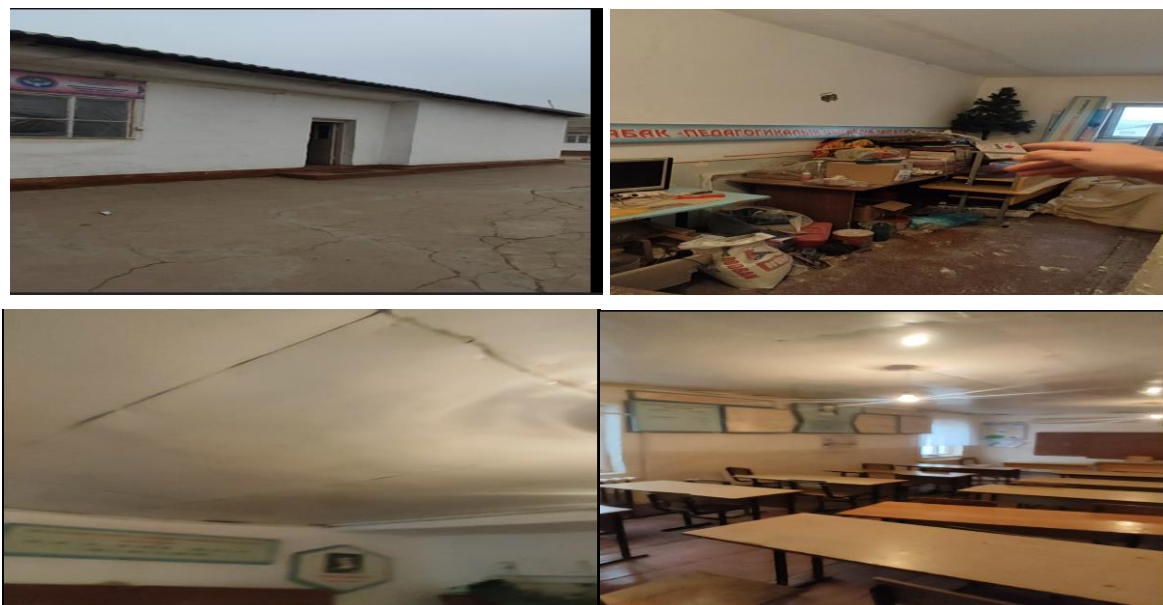
Рисунок 3. Фотографии объекта в с. Дейрес-Сай