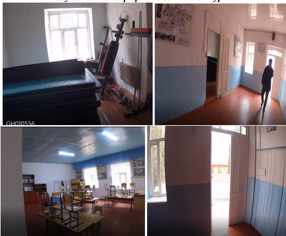
Рисунок 3. Фотографии объекта в с. Мурдаш