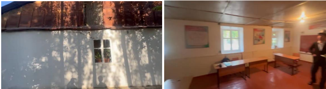
Рисунок 3. Фотографии детского сада в с. Чарбак