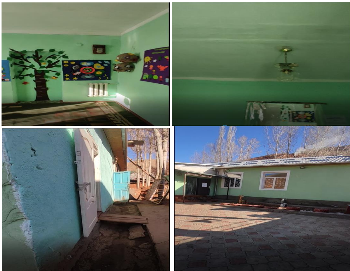
Рисунок 3. Фотографии объекта в с. Чон-Каракол