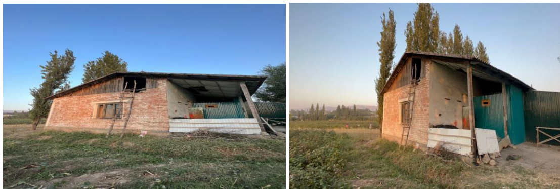
Рисунок 3. Фотографии детского сада в с. Кочубаево