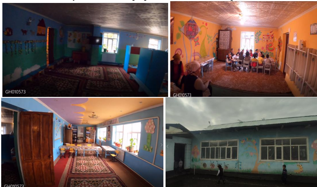
Рисунок 3. Фотографии объекта в с. Мырза-Аке