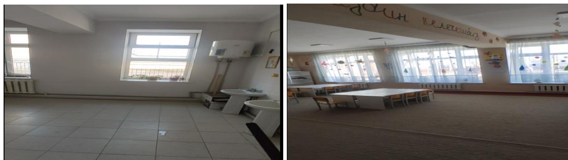
Рисунок 3. Фотографии объекта в с. Совет