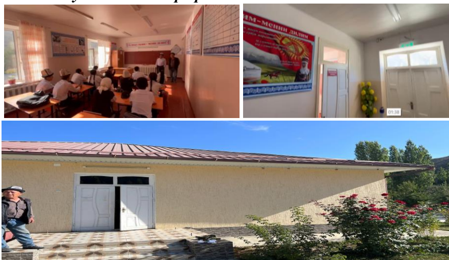
Рисунок 3. Фотографии детского сада в с. Божой