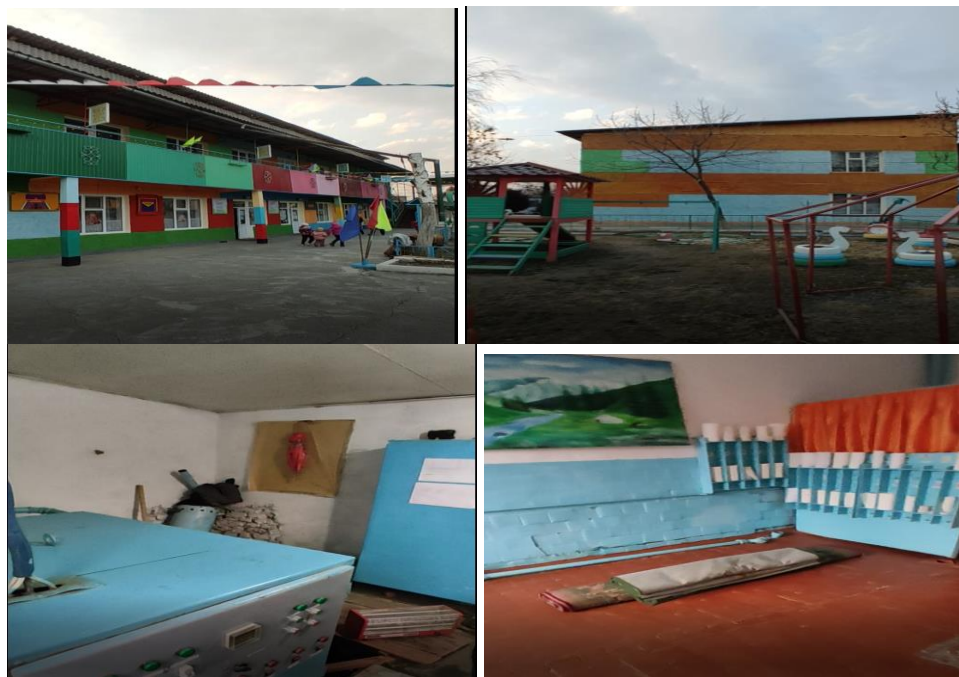
Рисунок 3. Фотографии объекта в с. Кара-Кулжа