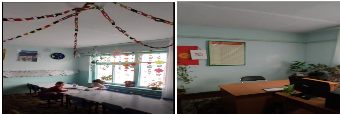
Рисунок 3. Фотографии объекта в с. Он-Эки-Бел