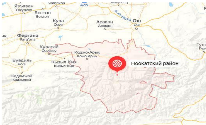
Рисунок 1. Местоположение района

По территории района проходят автодороги Ош - Ноокат -Кызыл-Кия, Ноокат – Араван, Ноокат – Папан.