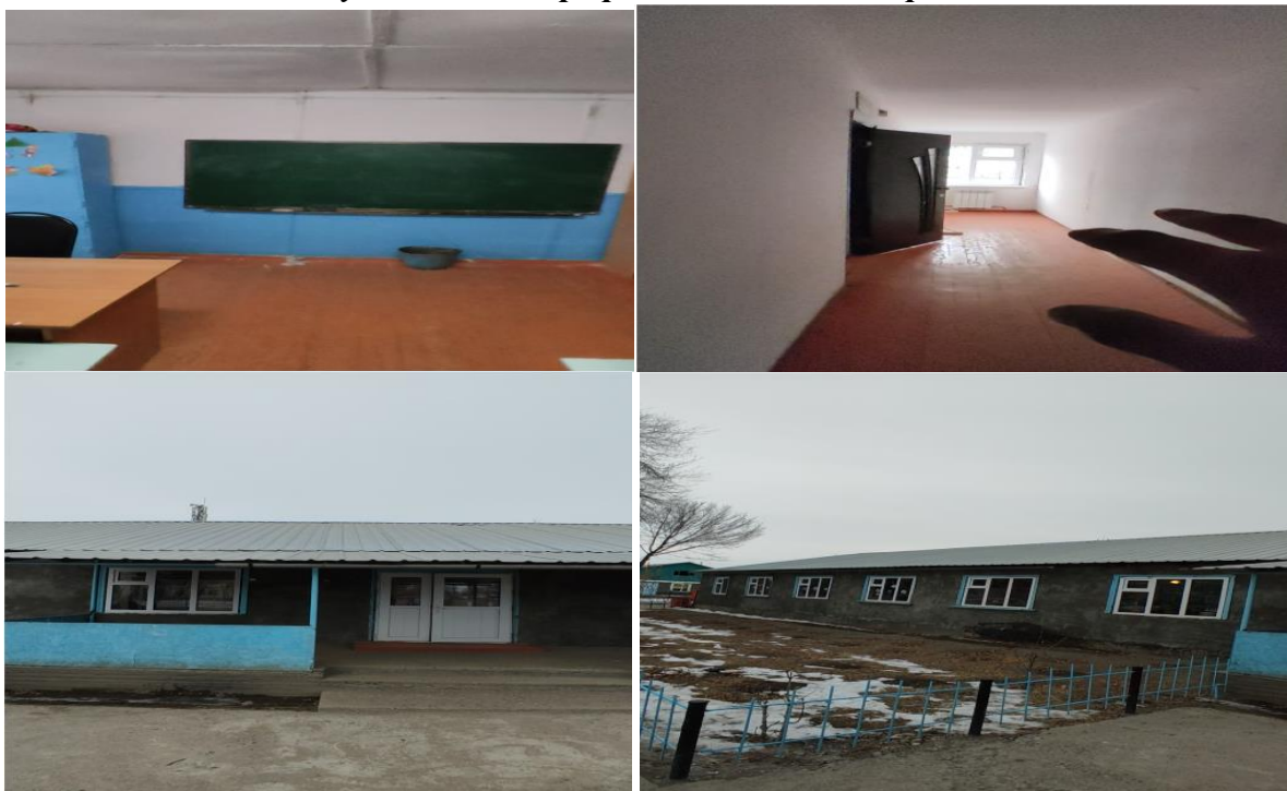
Рисунок 3. Фотографии объекта в с. Каргалык