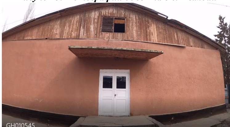
Рисунок 3. Фотографии объекта в с. Чымбай