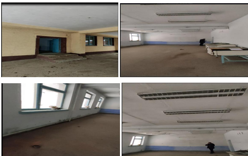
Рисунок 3. Фотографии объекта в с. Орто-Азия