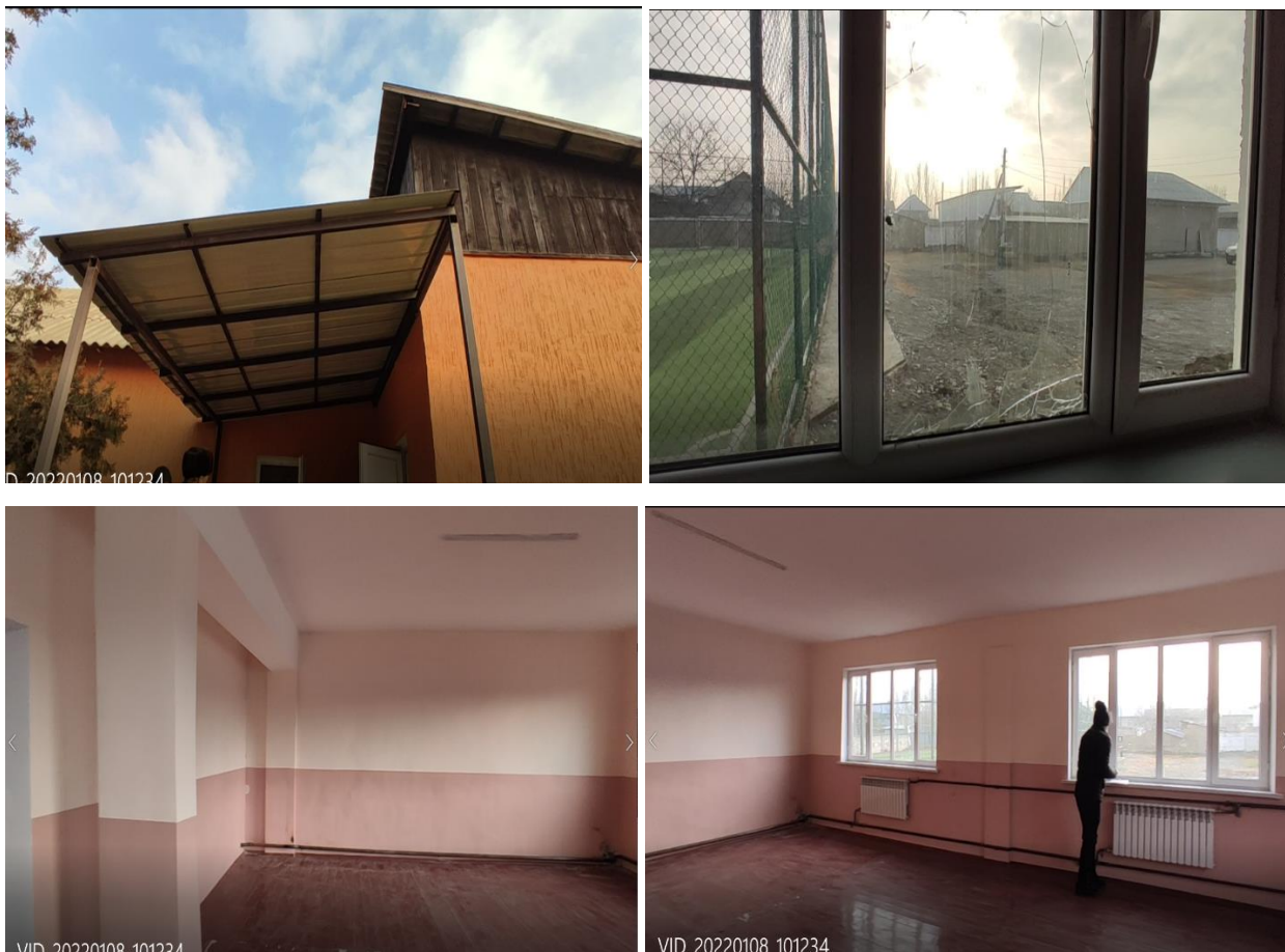
Рисунок 3. Фотографии объекта в с. Калинин