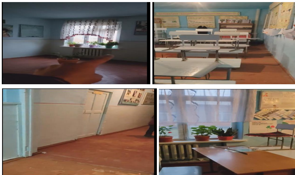
Рисунок 3. Фотографии объекта в с. Кызыл-Жар