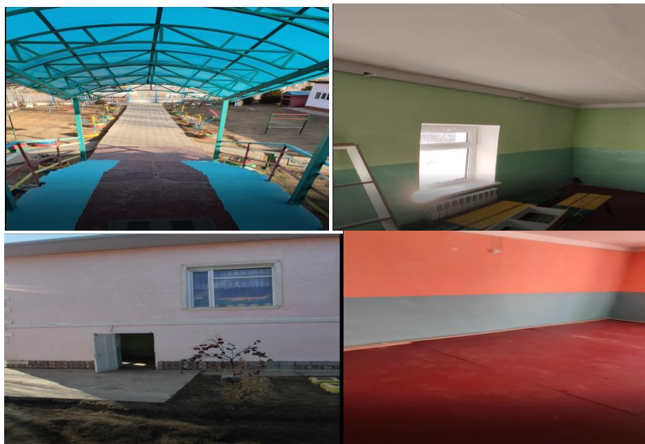
Рисунок 3. Фотографии объекта в с. Блай Талаа