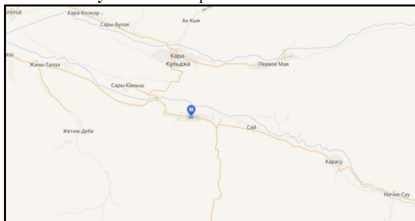
Рисунок 2. Место расположение объекта

Согласно оценочным данным Национального статистического комитета Кыргызской Республики, численность населения села на начало 2023 года составляла 7438 человек 3