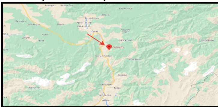
Рисунок 2. Место расположение объекта

В селе Согонду расположен детский садик, который в данное время функционирует и находится в удовлетворительном состоянии. Для создания ОДС кратковременного пребывания в вышеуказанном здании выделяются отдельно комнаты, в которых требуется провести ремонтно-восстановительные работы.