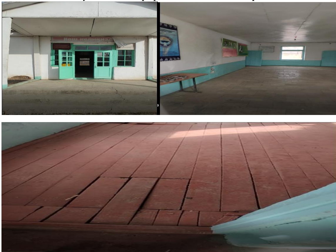
Рисунок 3. Фотографии объекта в с. им. Кирова