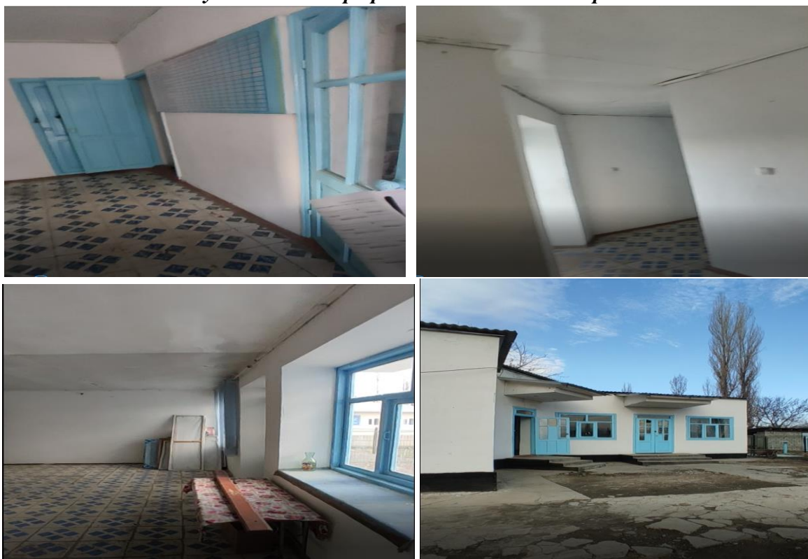
Рисунок 3. Фотографии объекта в с. Макаренко