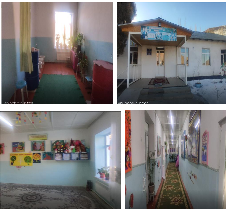
Рисунок 3. Фотографии объекта в с. Кабылан Кол