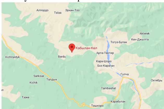
Рисунок 2. Место расположение объекта

В селе Кабылан-Кол расположен детский сад, который в данное время функционирует и находится в удовлетворительном состоянии. Для создания ОДС кратковременного пребывания в вышеуказанном здании выделяются отдельно комнаты, в которых требуется провести ремонтно-восстановительные работы.