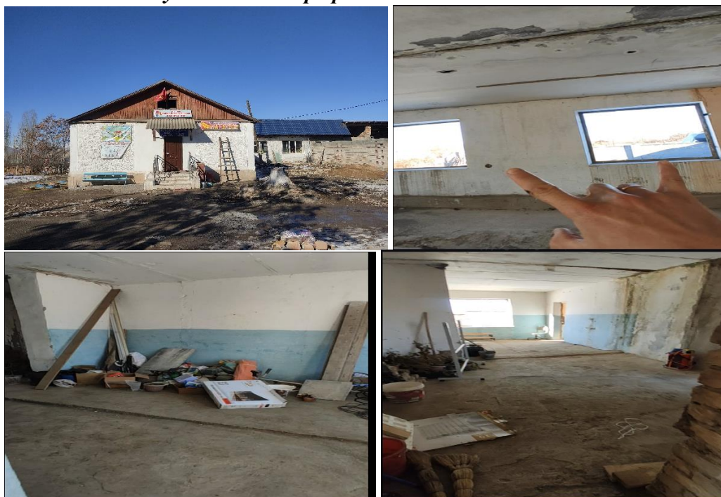
Рисунок 3. Фотографии объекта в с. Жалгыз-Жангак