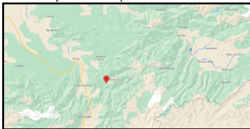
Рисунок 2. Место расположение объекта

В селе Кичи Болулу расположена СШ №36 им."Бакира Нарматова", которая в данное время функционирует и находится в удовлетворительном состоянии. Для создания ОДС кратковременного пребывания в вышеуказанном здании выделяются отдельно комнаты, в которых требуется провести ремонтно-восстановительные работы.