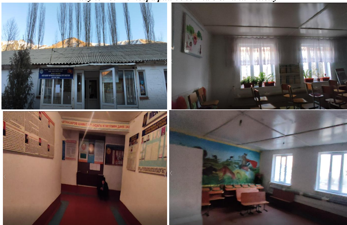
Рисунок 3. Фотографии объекта в с.Кичи Бололу