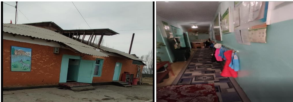
Рисунок 3. Фотографии объекта в с. Он-Эки-Бел