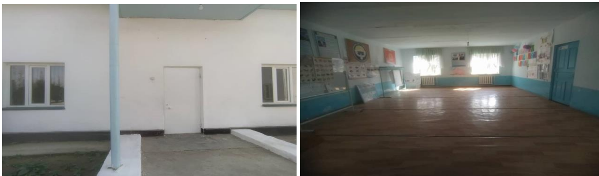
Рисунок 3. Фотографии объекта в с. Достук