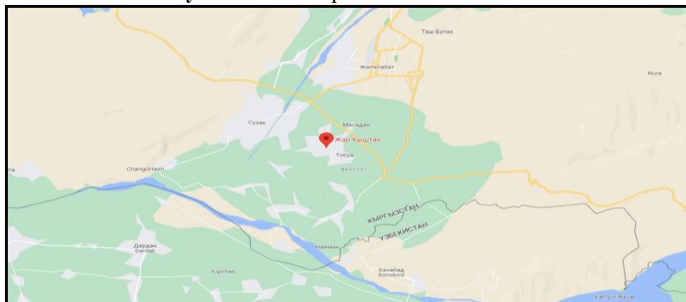
Рисунок 2. Место расположение объекта

В Барпынском аильном округе расположено здание детского сада им."Жоогазын" которое в данное время функционирует и находится в удовлетворительном состоянии. Для создания ОДС кратковременного пребывания в вышеуказанном здании выделяются отдельно комнаты, в которых требуется провести ремонтно-восстановительные работы.