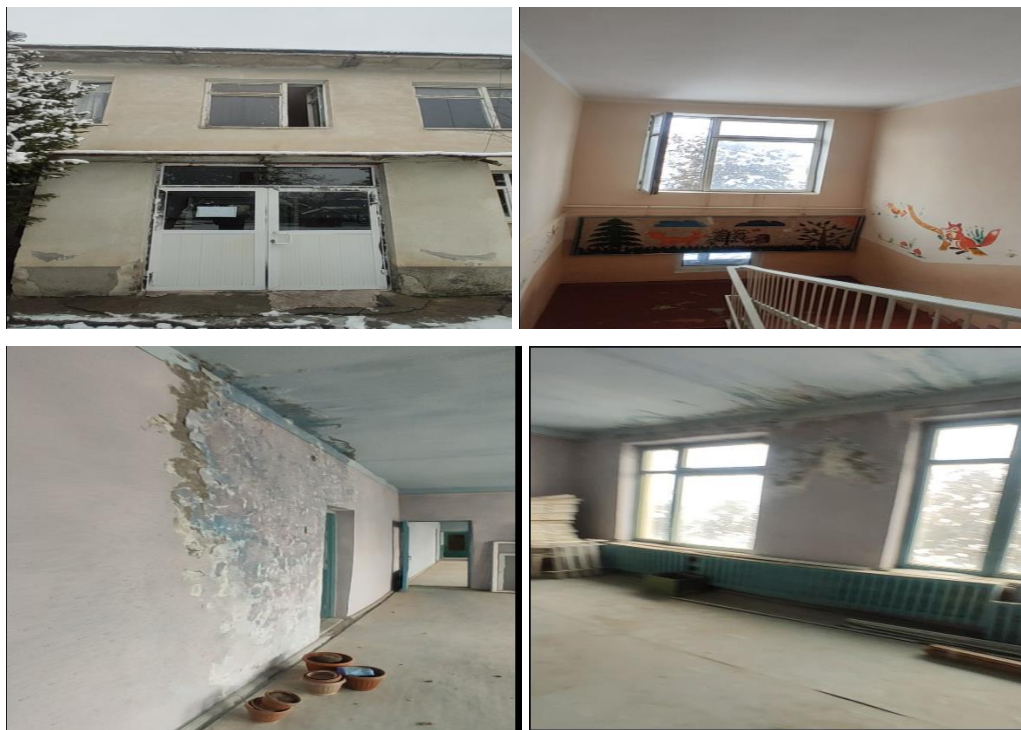
Рисунок 3. Фотографии объекта в с. Жар-Кыштак