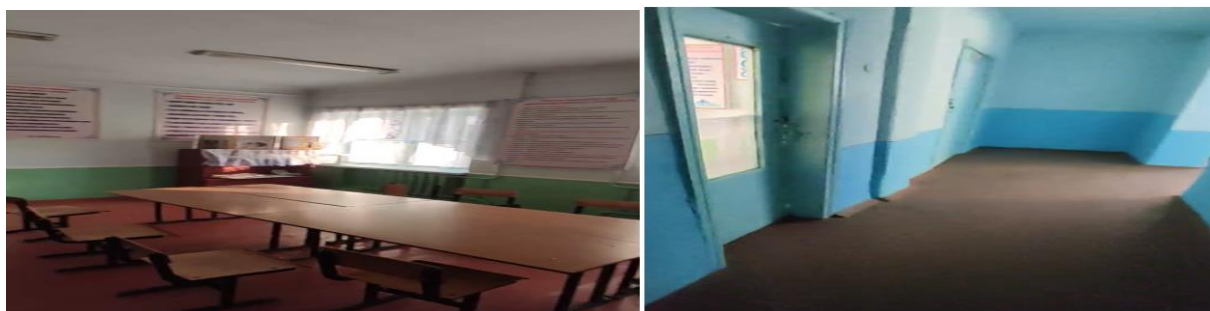
Рисунок 3. Фотографии объекта в г. Базар-Коргон