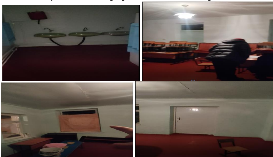
Рисунок 3. Фотографии объекта в с. Мырза-Аке