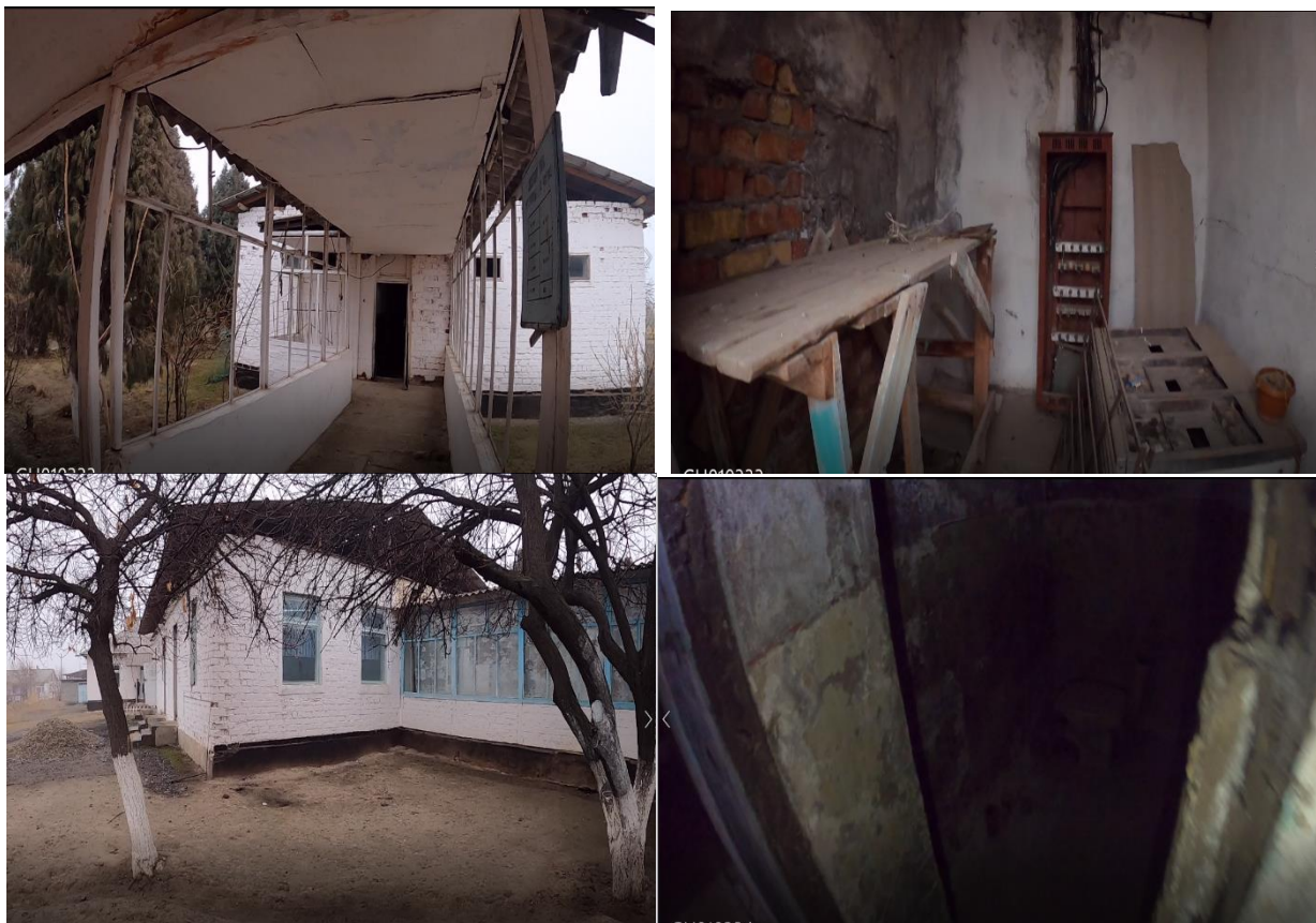
Рисунок 3. Фотографии объекта в с. Тынчтык