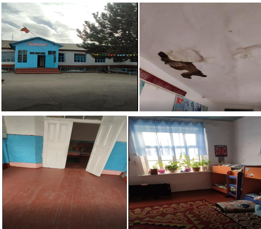
Рисунок 3. Фотографии объекта в с. 1 Мая