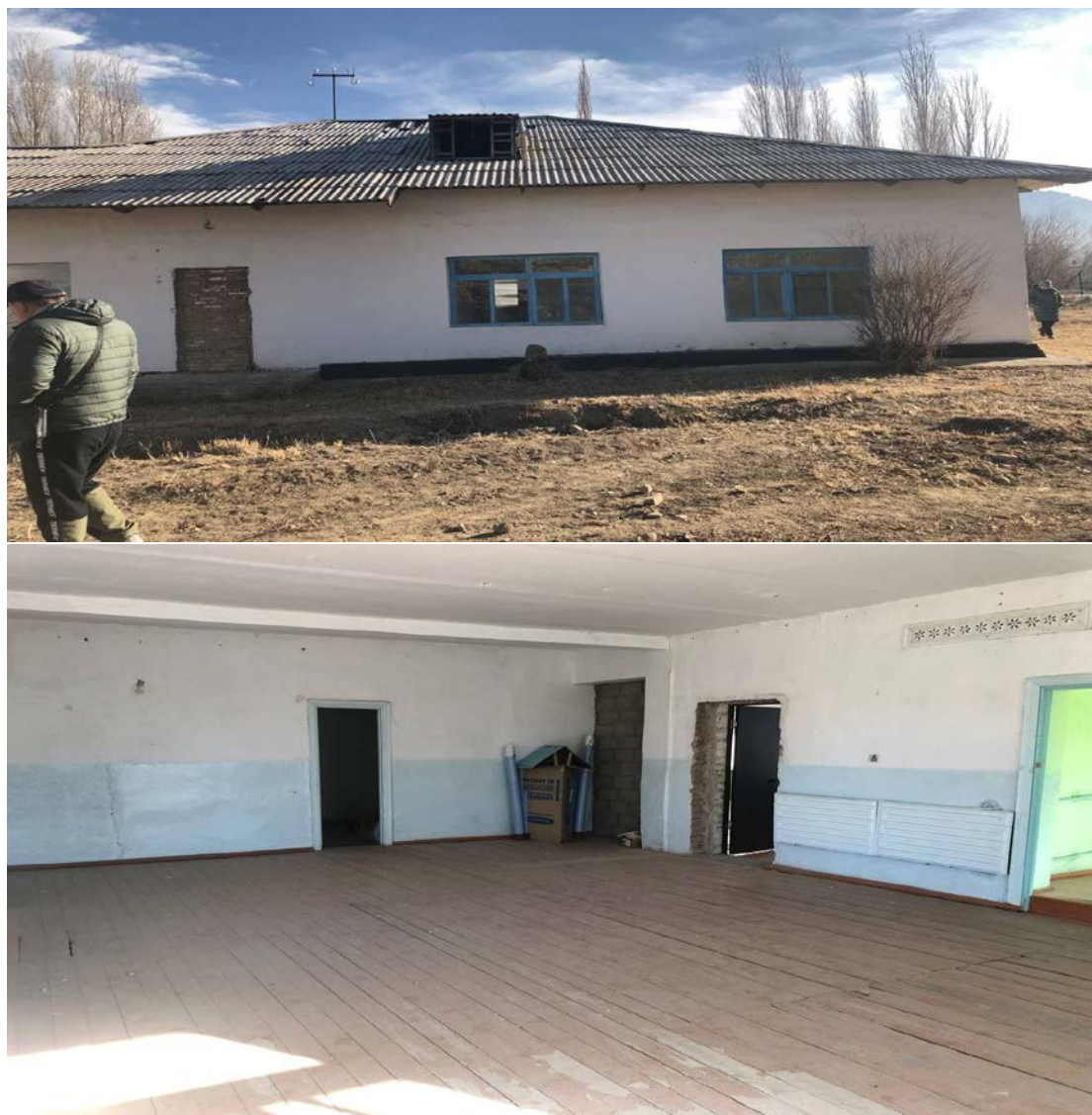
Рисунок 3. Фотографии детского сада в с. Кара-Суу