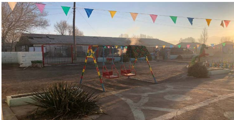
Рисунок 3. Фотографии детского сада в с. Кара-Тоо

Доработка грунта вручную в траншеях , группа грунтов 3 Перевозка грузов I класса автомобилями-самосвалами грузоподъемностью 10 т работающих вне карьера на расстояние до 10 км Устройство бетонной подготовки Устройство круглых сборных железобетонных канализационных колодцев диаметром 2 м в грунтах сухих Установка закладных деталей весом до 4 кг КЦ20-9 КЦП 2-20 КЦД 1-20 Люк чугунный Стремянка Железнение поверхности(внутри) Гидроизоляция боковая обмазочная битумная в 2 слоя по выравненной поверхности бутовой кладки, кирпичу, бетону Скамья с козырьком Пожарный щит с доставкой Копание ям вручную без креплений для стоек и столбов без откосов глубиной до 0,7 м группа грунтов 3 Установка металлических столбов высотой до 4 м с погружением в бетонное основание Бетон (класс по проекту) Стойки металлические опорные Изготовление решетчатых конструкции (стойки, опоры, фермы и пр.) Монтаж ферм, обрешеток Конструкции стальные Огрунтовка металлических поверхностей за один раз грунтовкой ГФ-021