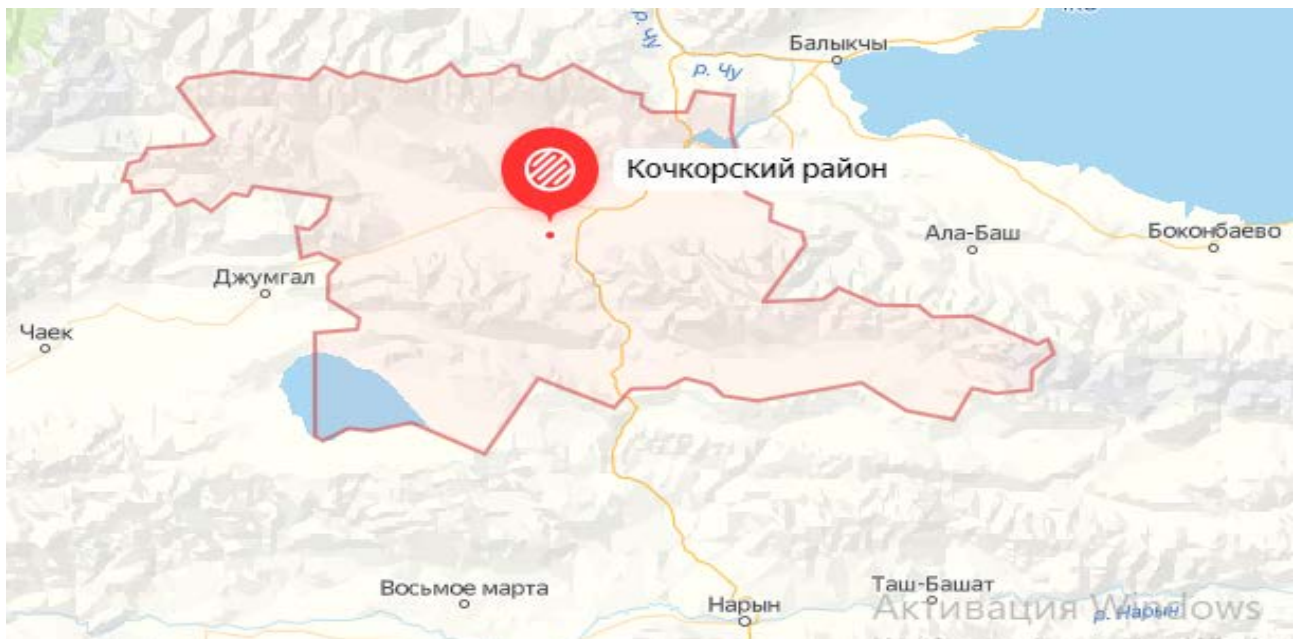
Рисунок 1. Местоположение района

По территории района проходят автодорога международного значения Бишкек – Нарын – Торугарт, автодороги Кочкорка – Чаек – Арал, Сары-Булак – Джер-Кёчкю.