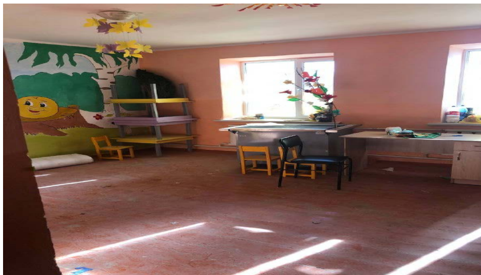
Рисунок 3. Фотографии средней школы в с. Арсы

Устройство бетонной подготовки (бетонирование площадок)