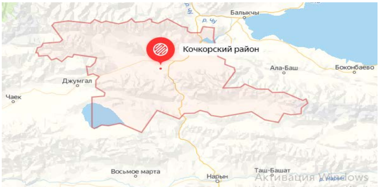
Рисунок 1. Местоположение района

По территории района проходят автодорога международного значения Бишкек – Нарын – Торугарт, автодороги Кочкорка – Чаек – Арал, Сары-Булак – Джер-Кёчкю.