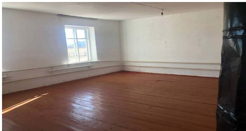
Рисунок 3. Фотографии средней школы в с. Кара-Мойнок

Уплотнение грунта гравием Устройство подстилающих слоев бетонных Устройство гидроизоляции обмазочной в один слой толщиной 2 мм Устройство покрытий на клее (сухих смесях) из керамических плиток размером: до 300х300 мм Устройство тепло- и звукоизоляции сплошной из плит или матов минераловатных или стекловолоконистых Пеноплекс 5 Высококачественная штукатурка декоративным раствором по камню стен гладких Раствор декоративный Улучшенная окраска масляными составами по штукатурке стен Установка в жилых и общественных зданиях оконных блоков из ПВХ профилей: поворотных (откидных, поворотно-откидных) с площадью проема более 2 м 2 трехстворчатых в том числе при наличии створок глухого остекления Установка блоков из ПВХ в наружных и внутренних дверных проемах в каменных стенах площадью проема до 3 м 2 Установка металлических дверных блоков в готовые проемы Двери металлические