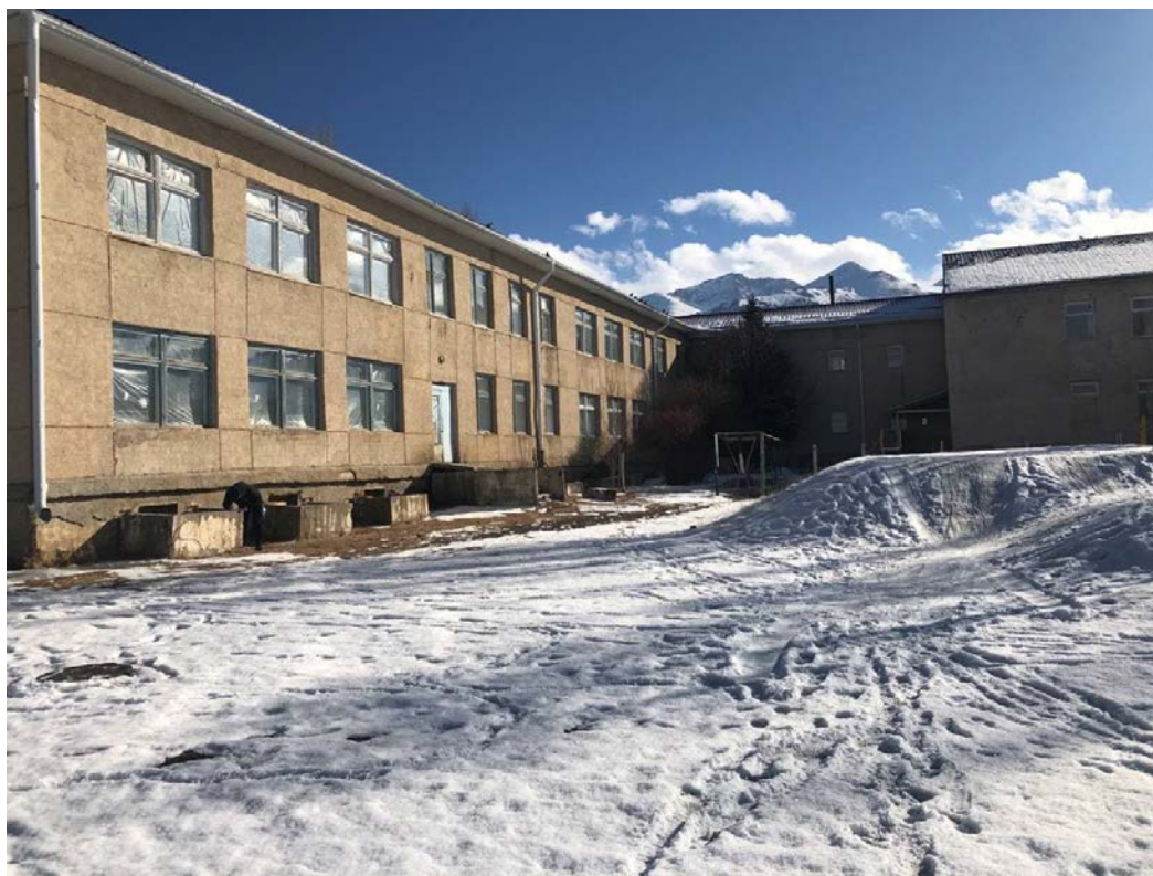
Рисунок 3. Фотографии школы в с. 1 Мая

Копание ям вручную без креплений для стоек и столбов без откосов глубиной до 0,7 м группа грунтов 3 Установка металлических столбов высотой до 4 м с погружением в бетонное основание Бетон (класс по проекту) Стойки металлические опорные Изготовление решетчатых конструкции (стойки, опоры, фермы и пр.) Монтаж ферм ,обрешеток Конструкции стальные Огрунтовка металлических поверхностей за один раз грунтовкой ГФ-021 Окраска металлических огрунтованных поверхностей эмалью ПФ-115 Монтаж кровельного покрытия из профилированного листа при высоте здания до 25 м Профнастил 0,7мм Крыльцо и отмостка Устройство отмостки Устройство желобов подвесных Желоб 3м Кронштейн