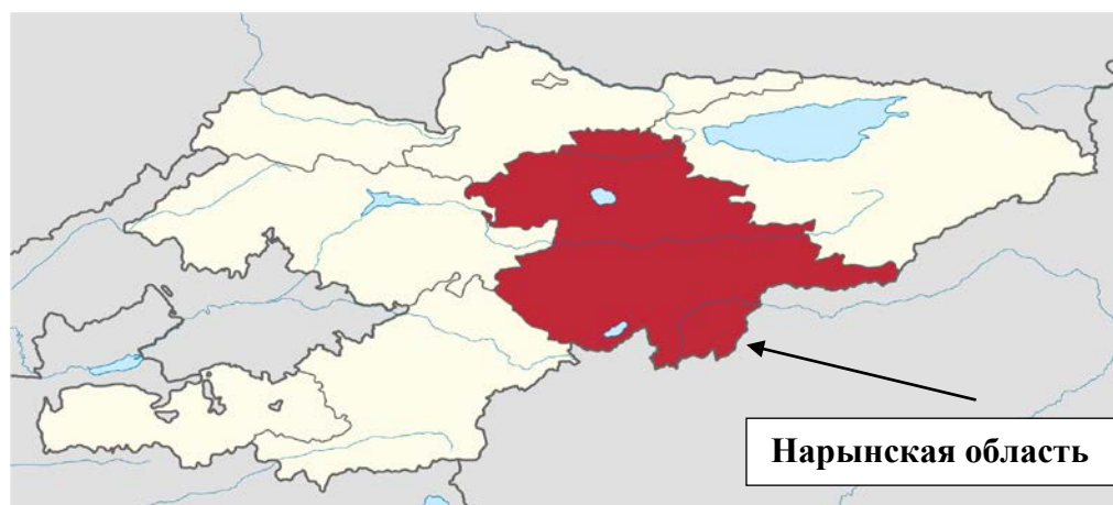
Рисунок 1. Местоположение района