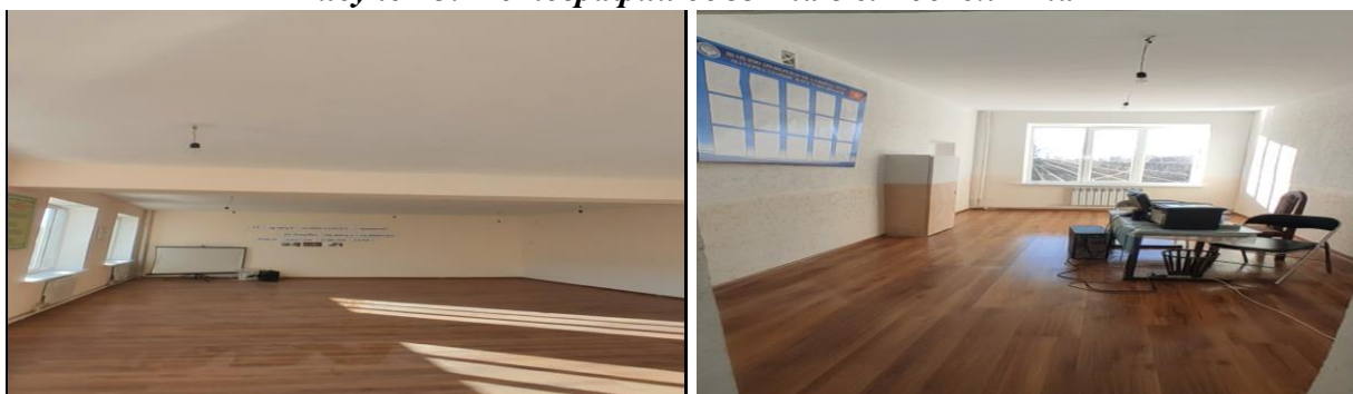
Рисунок 3. Фотографии объекта в с. Тоскол Ата