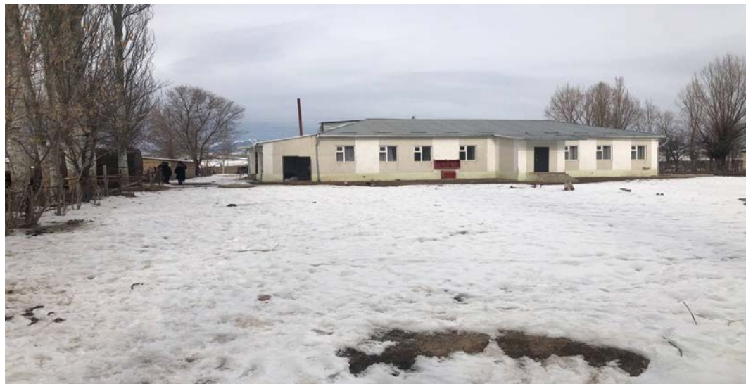
Рисунок 3. Фотографии детского сада в с. Жылдыз

Гидроизоляция боковая обмазочная битумная в 2 слоя по выравненной поверхности бутовой кладки, кирпичу, бетону Скамья с козырьком Пожарный щит с доставкой