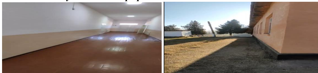
Рисунок 3. Фотографии объекта в с. Молдо Жалила