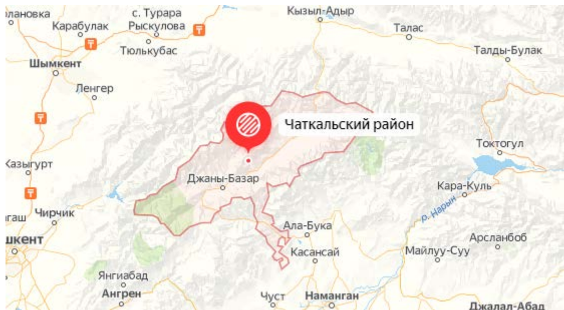
Рисунок 1. Местоположение района